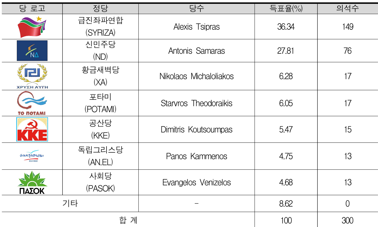
<정당별 예상득표율 및 의석 수>